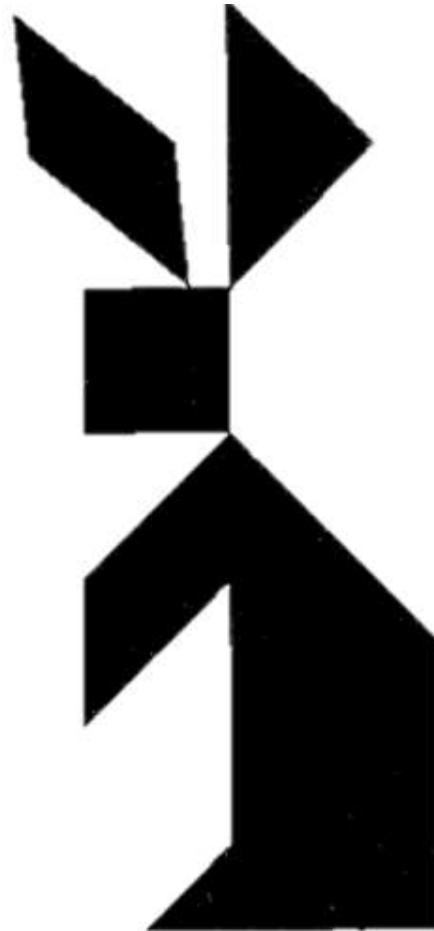
Figure à réaliser :

Lorsque vous avez réalisé la figure, montrez-la au maître qui vous donnera le prochain indice.